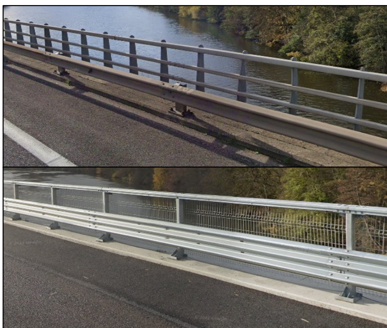
Figure 2: Avant/Après - Rives

L'objet des travaux de cette troisième phase est : la réparation des appareils d'appui.