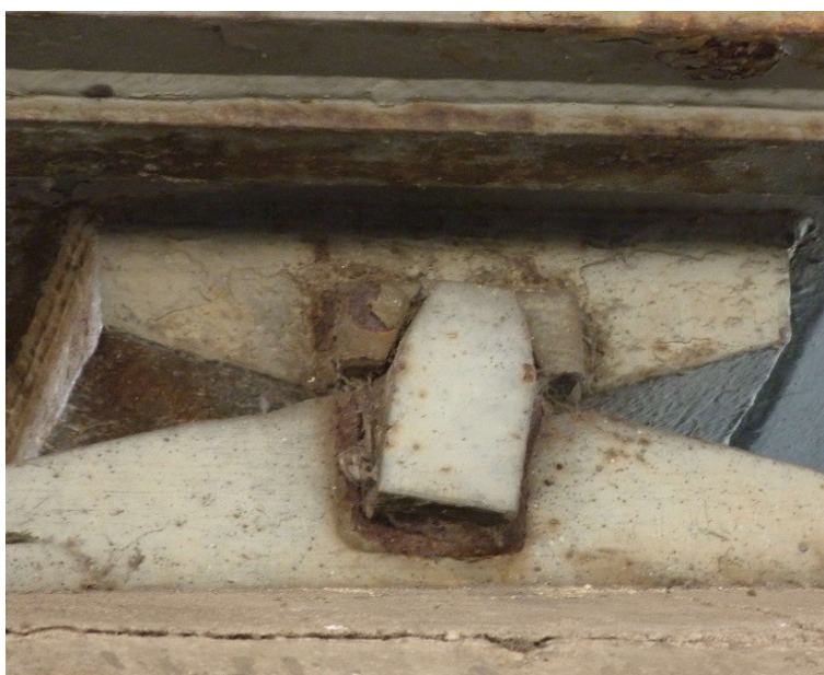
Figure 3: Appareil d'appuis existant

L'objet des travaux de cette troisième phase est : la réparation des appareils d'appui.