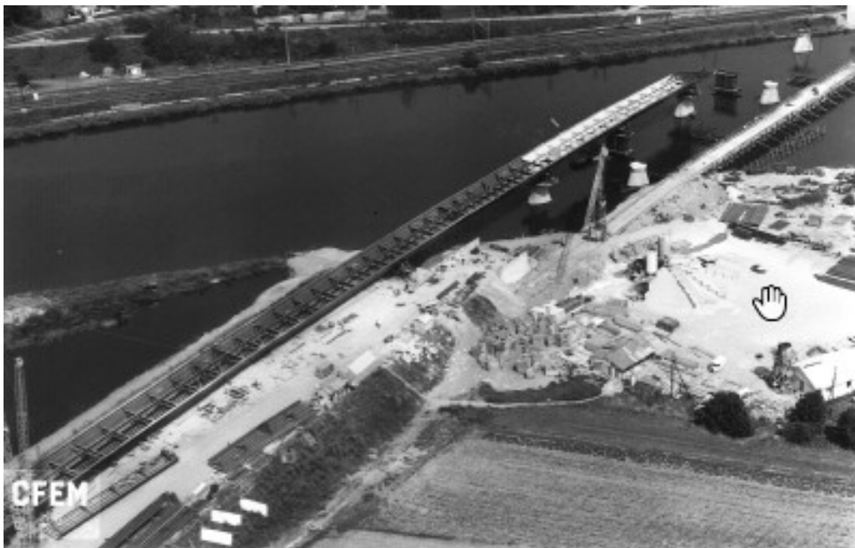
Figure 1: photographie de la construction de l'ouvrage

L'ouvrage a été construit de 1968 à 1970 par l'entreprise CFEM (devenue EIFFEL CM en 1989) et mis en service en même temps que l'autoroute A31 en 1972.