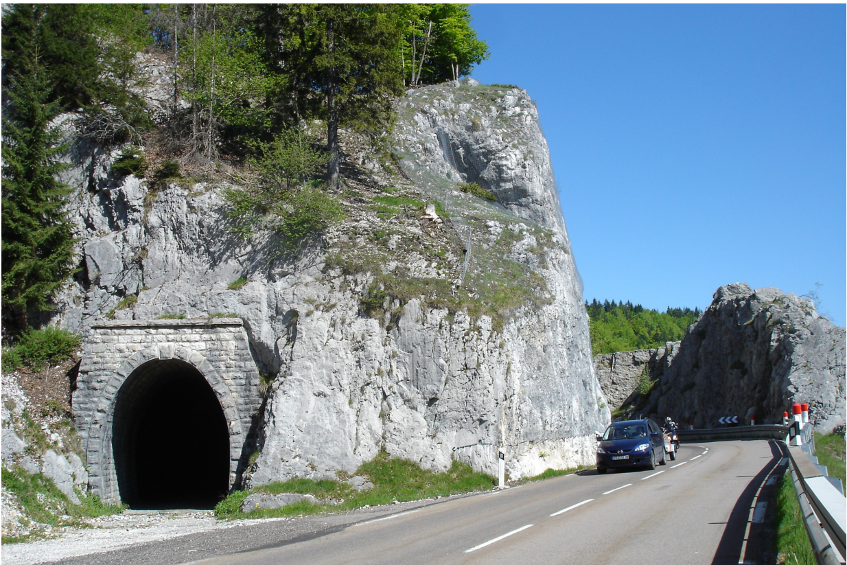
Virage du Turu

Les travaux du Gouland seront lancés durant l'été 2015 pour une durée de deux mois.