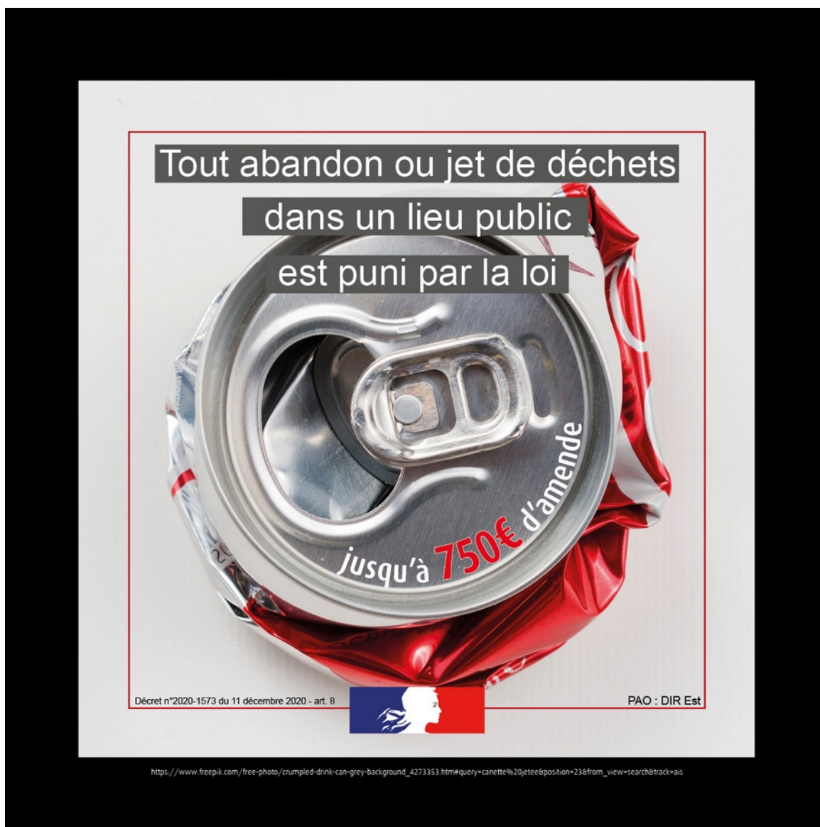
image : Crumpled drink can on grey background

Décret n°2020-1573 du 11 décembre 2020 - art. 8