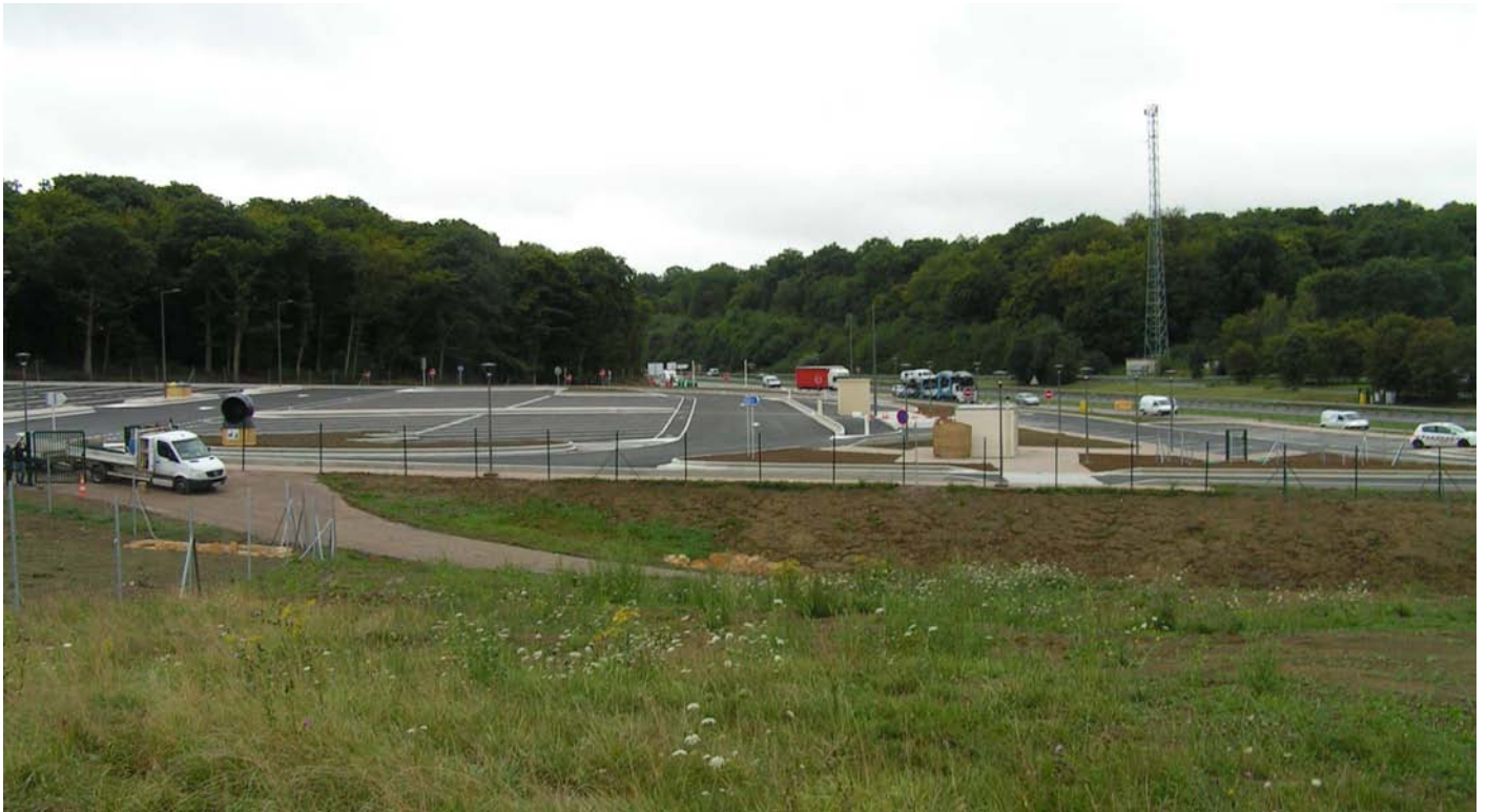
Vue générale de l'aire du Bois du Juré avant inauguration

La DIR Est a fait le nécessaire pour minimiser les coûts d'entretien et les rendre compatibles avec son budget de fonctionnement. Néanmoins, il est certain que seul un respect des règles de civisme par les usagers permettra de conserver sur le long terme une aire propre et accueillante.