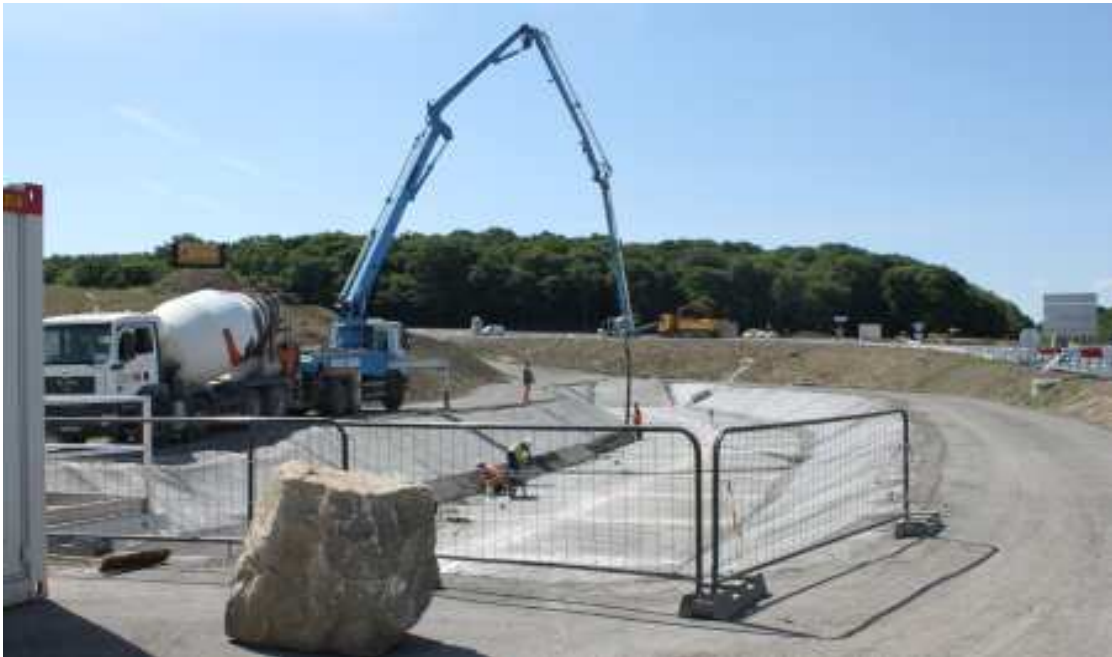
Création du bassin

■ Réalisation de l'élargissement de l'aire , phase qui comprend la majeure partie des travaux d'augmentation de capacité de l'aire et de son équipement, ainsi que la création du bassin. La circulation a été maintenue sur l'A31. Les bretelles d'accès à l'aire ont été condamnées.