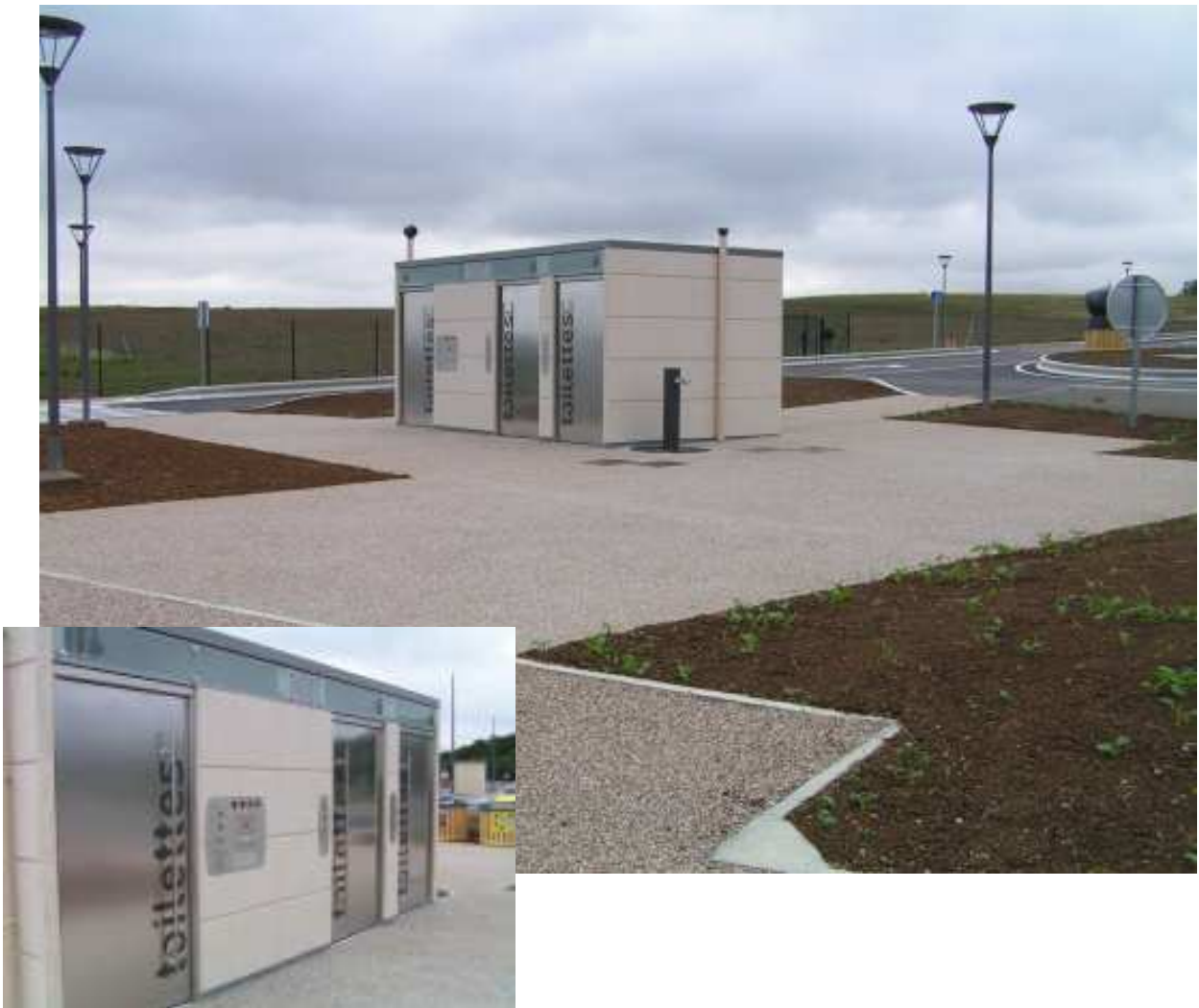
Mise en place d'un bloc sanitaire autonome