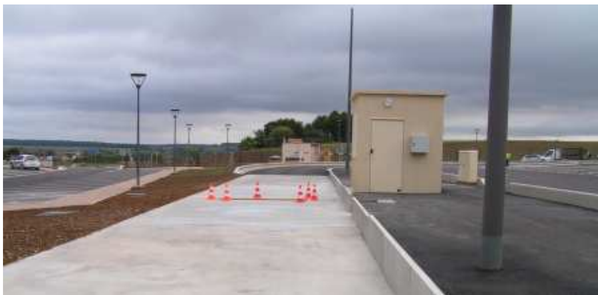
Implantation d'une aire de pesée

La rénovation et l'extension de cette aire a été retenue en priorité parce qu'elle dispose de la plus grande capacité d'extension. En effet, le nombre de places PL a été multiplié par cinq. Elle permet ainsi d'augmenter de 25 % la capacité de l'axe Nancy-Luxembourg en places de stationnement PL. Cette aire contribuera à une meilleure sécurité de tous les usagers, grâce à de meilleures conditions d'accueil notamment pour les temps de repos.