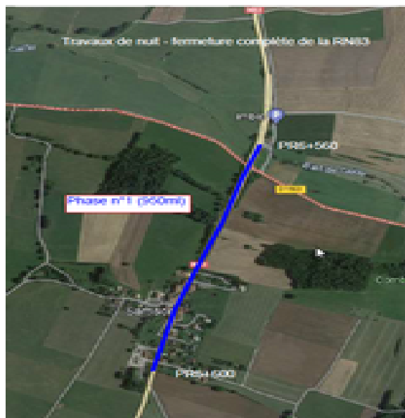
Phase 1 : traversée de Samson < > carrefour RN83/RD15E

Travaux réalisés de nuit, sous fermeture complète de la RN 83 durant 4 nuits entre 21h et 5h et déviations dans les deux sens de circulation. Circulation rétablie sur voies réduites avec réduction de capacité en journée.