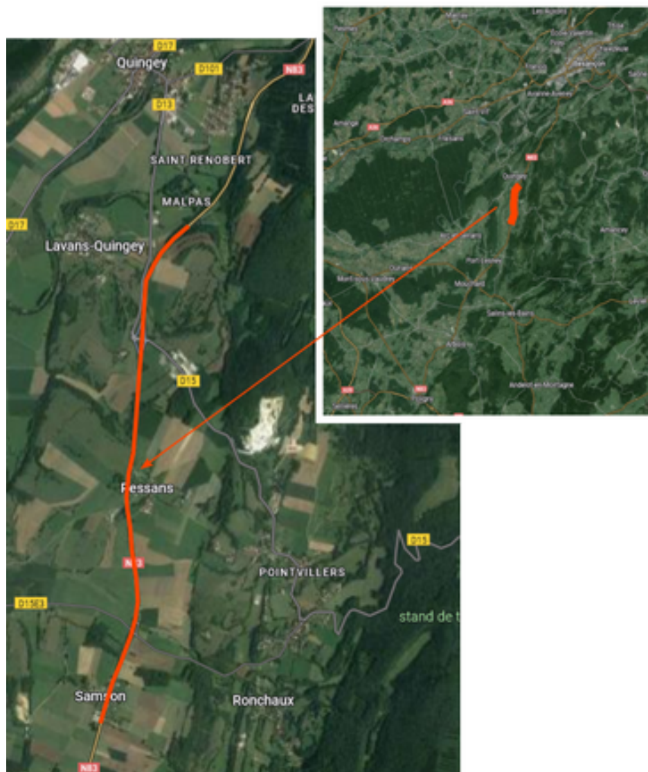
Zone concernée par les travaux

Dans le cadre de son programme d'amélioration des itinéraires, la DIR EST va mener entre 13 mai et le 7 juin 2024 des travaux de réfection de chaussée avec renouvellement de la couche de roulement de la RN83 entre Samson et Quingey, sur un linéaire de 4,6 km, dans la continuité des travaux réalisés en 2023 entre Rennes-sur-Loue et Samson.